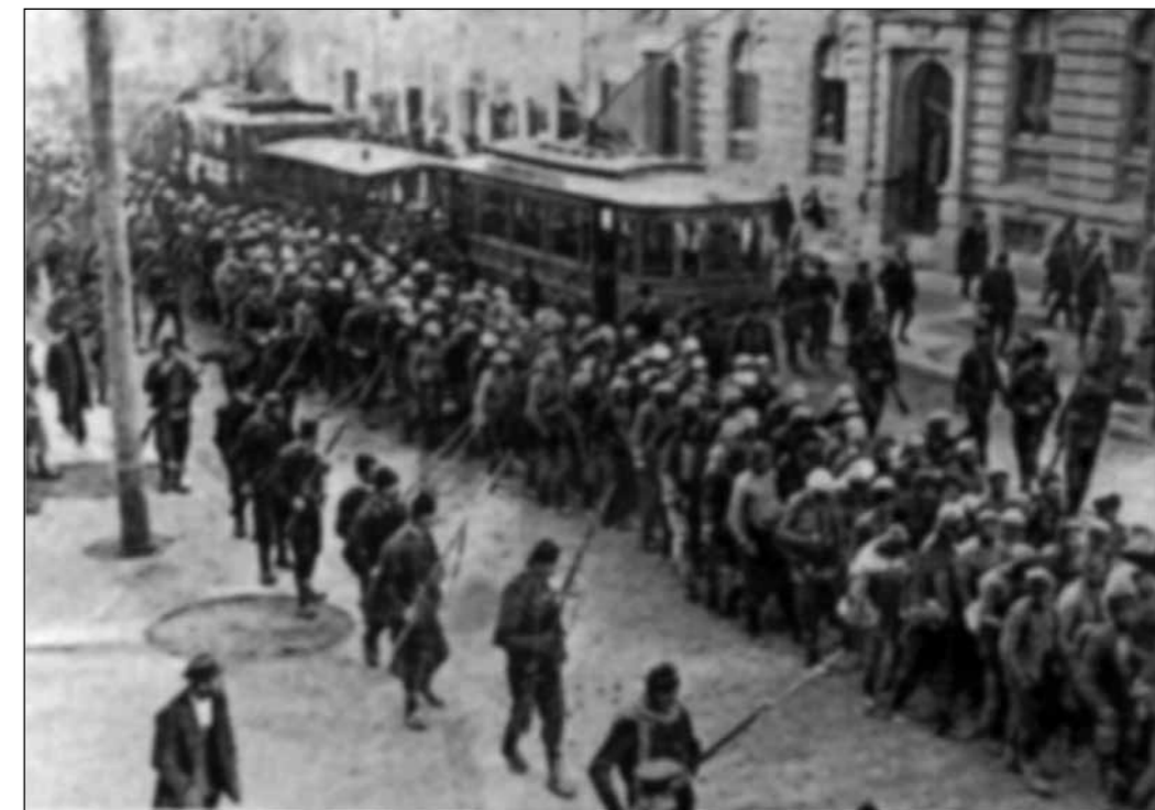
Esir Türk Askerleri Filibe sokaklarından geçiriliyor

Sergi, Pazar ve resmi tatil günleri hariç, 09.00 - 19.00 saatleri arasında açıktır.