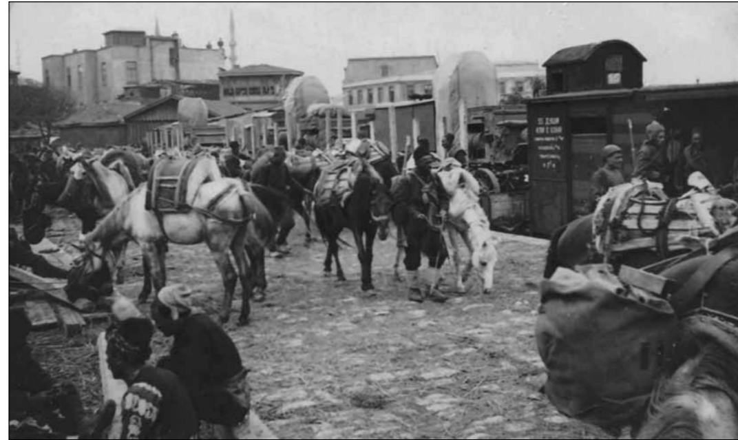
Ordumuzun bir ikmal kolu