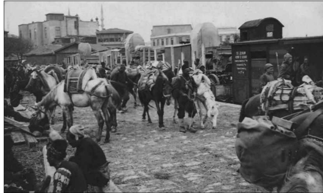
Ordumuzun bir ikmal kolu