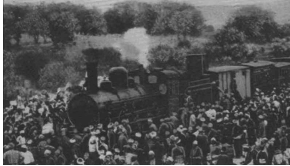
Batı Trakya'dan kaçış