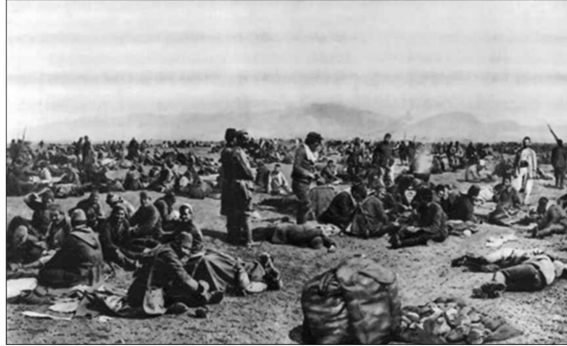
Ordumuzun istirahat anı

BİLAY-Bilgi Araştırma ve Yönetim Vakfı Yönetim Kurulu Başkanı