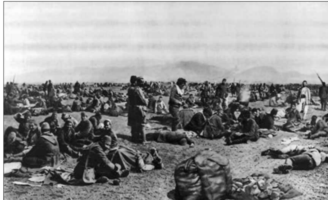
Ordumuzun istirahat anı

BİLAY-Bilgi Araştırma ve Yönetim Vakfı Yönetim Kurulu Başkanı