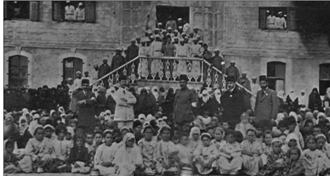
Dul ve yetimler