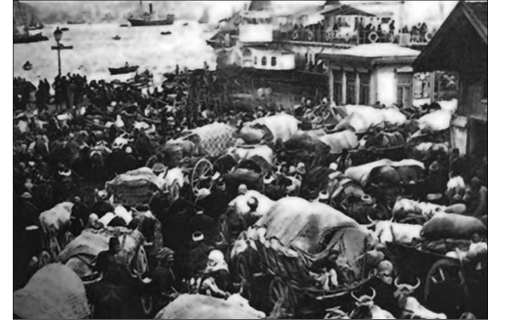
Rumeli'den İstanbul'a gelip, Anadolu'ya geçmeyi bekleyen muhacirler, 23 Kasım 1912