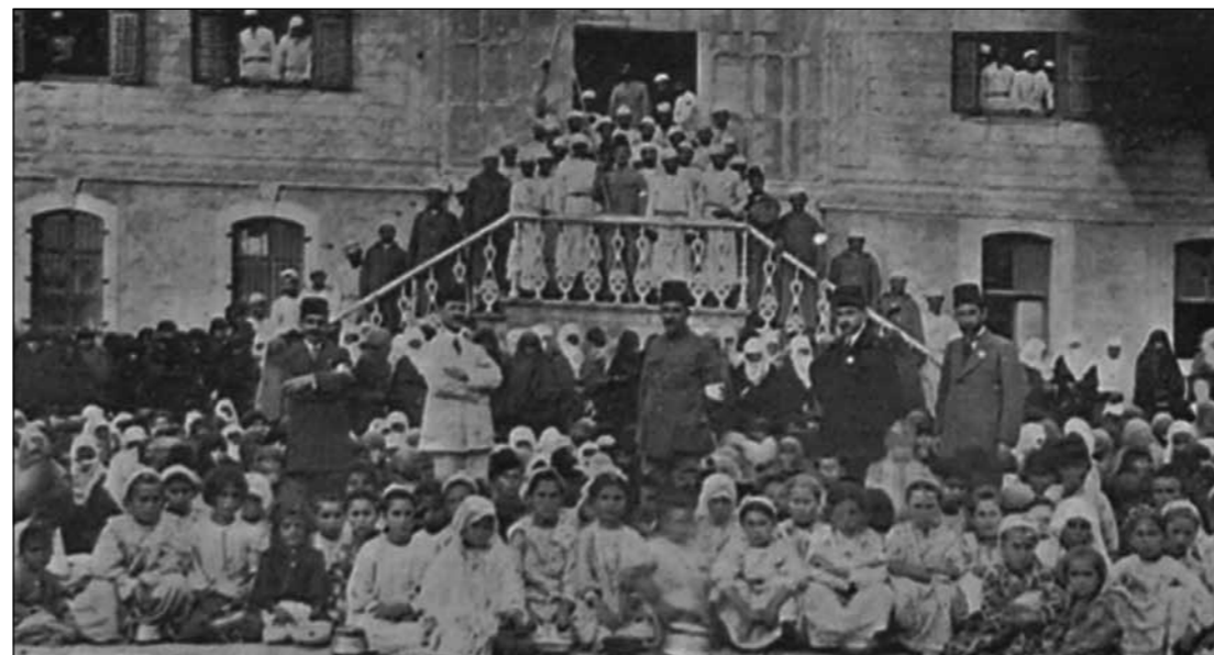
Dul ve yetimler